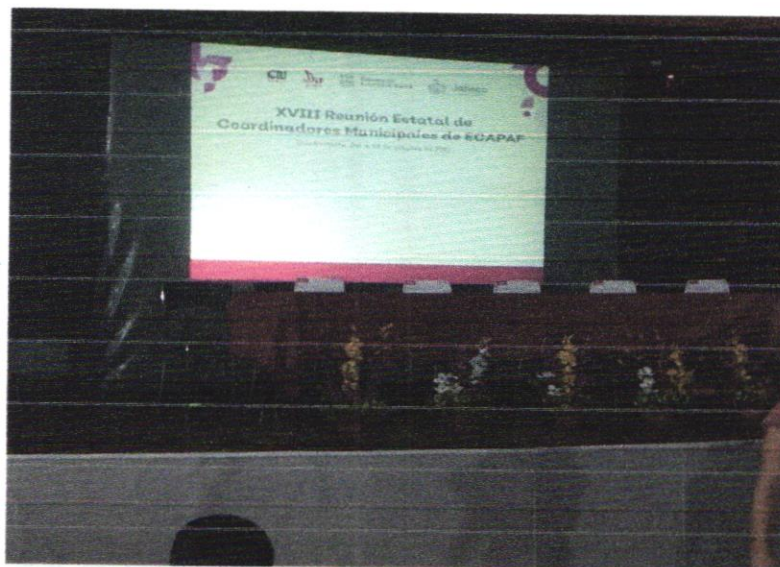
Anexo 3. Capacitación de Reunión Estatal de Coordinadores Municipales de ECAPAF (Octubre, 2019)