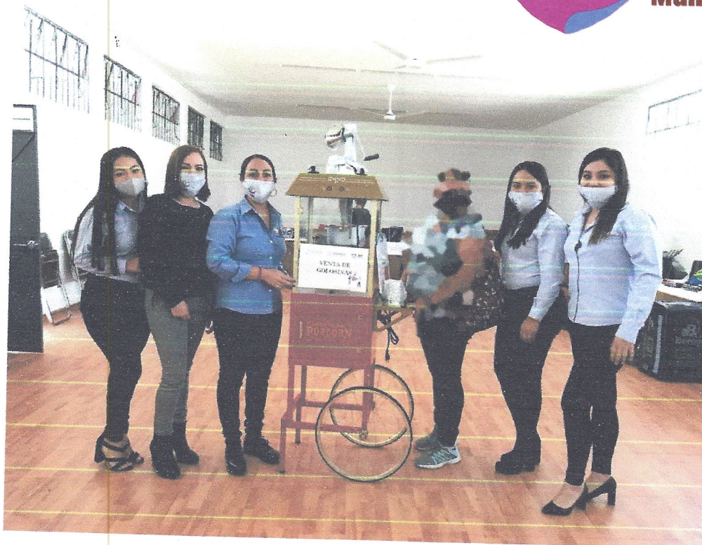
ANEXO 2. ENTREGA PROYECTO 49