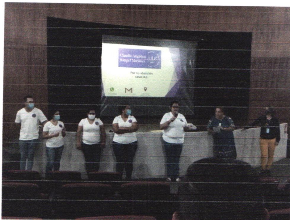
Anexo 4. Capacitación sobre Masculinidades. (Octubre , 2020)

Sin más por el momento me despido, quedando a la orden para cualquier duda o aclaración.